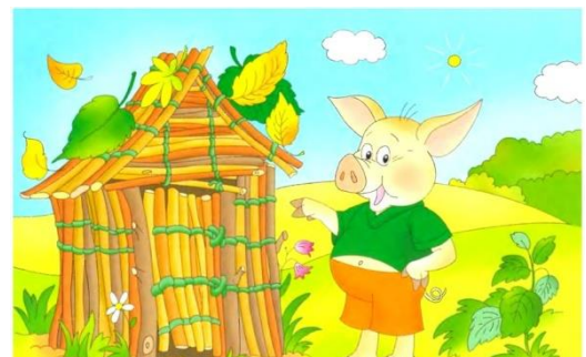
Картинка № 2